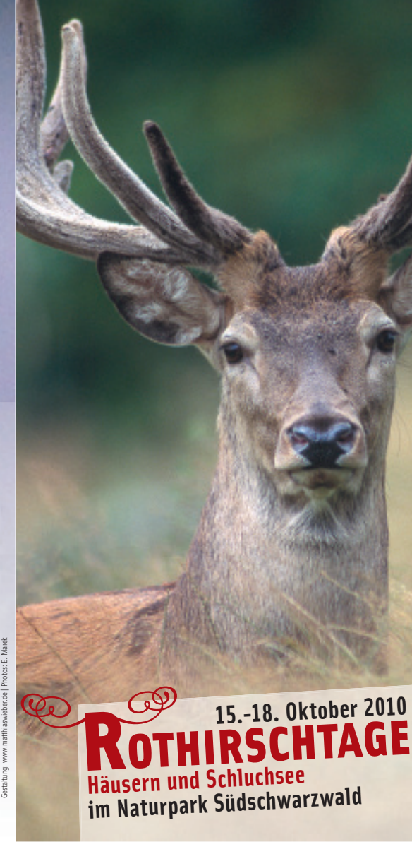
Gestaltung: www.mathiaswieser.de

Dieses Projekt wurde gefördert durch den Naturpark Südschwarzwald mit Mitteln des Landes Baden-Württemberg, der Lotterie Glücksspirale und der Europäischen Union (ELER).